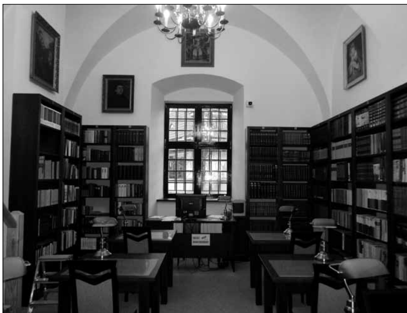
Fot. 6. Czytelnia im. ks. Andrzeja Wyrzykowskiego