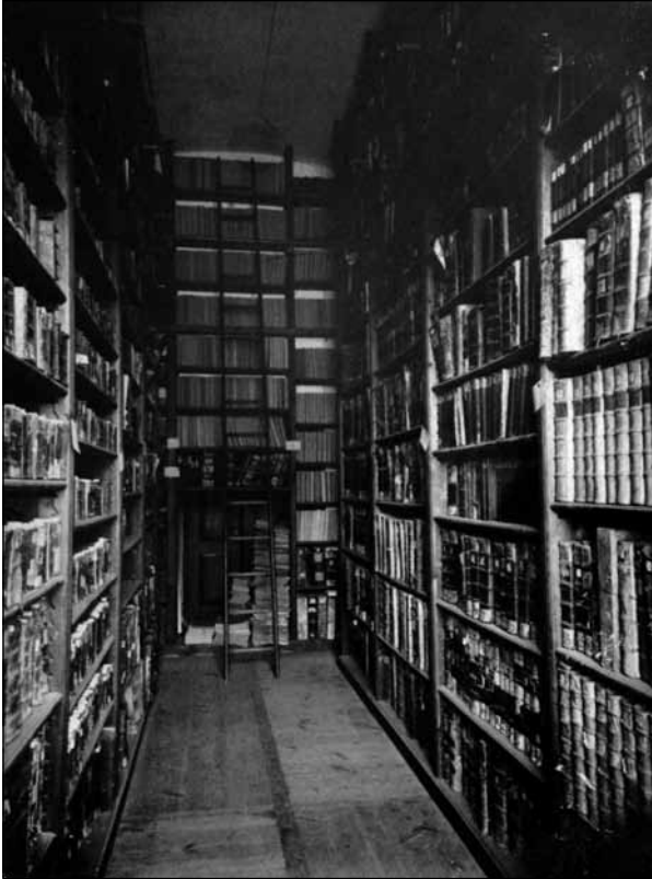
Fot. 4. Jeden z magazynów bibliotecznych, ok. 1915

w tym 18 tys. starodruków 54 . Wspomniany bibliotekarz osobiście prowadził wypożyczalnię. Podczas udostępniania książek udzielał cennych rad bibliograficznych. W 1933 roku został członkiem Koła Związku Bibliotekarzy Polskich we Lwowie. Współpracował i korespondował z wieloma uczonymi, służąc im informacjami o zbiorach sandomierskich 55 .