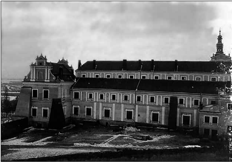
Fot. 3. Obecna siedziba biblioteki seminaryjnej w Sandomierzu, ok. 1905